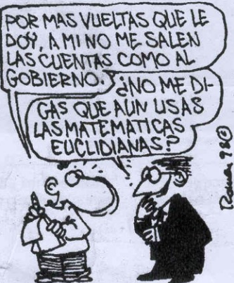
El humorista Romeu también habla de matemáticas.

¿Podría el humor ayudar a salvar alguno de estos inconvenientes? Los profesores de Didáctica de las Matemáticas están convencidos de que puede contribuir a